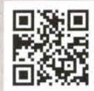
ローソンチケット (Lコード:32522)