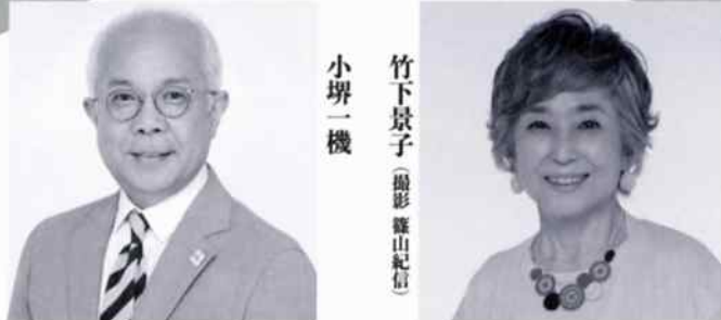
竹下景子 小堺一機